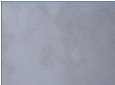
przykładowa struktura ASDecorative MEDIUM

Mikrocement ASDecorative MEDIUM jest bardzo popularnym i uniwersalnym mikrocementem jednoskładnikowym w postaci białego proszku, o specjalnie selekcyjonowanej średniej frakcji kruszywa kwarcu. Produkt przed użyciem do rozrobienia z czystą lub zabarwioną wodą.