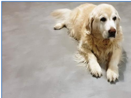
przykładowa podłoga z ASDecorative MEDIUM